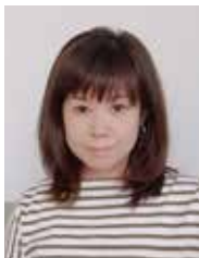
日本アイラック株式会社 カスタマーソリューション事業部

一方でカスタマーハラスメントは、怒りに任せた悪質な行為です。「ただ困らせたい」という意識が強く、そこにサービス改善への期待や希望といった要素はありません。そのため、落ち着いた話し合いはおろか、建設的な関係性の構築も望めない場合がほとんどです。中には、「荒々しい言葉づかいだけど主張自体は正当」「直接的ではないものの、遠回しに要求をほのめかしてくる」といったケースもあるでしょう。法律に抵触しない限り判断が難しいところではありますが、それらの行為によって精神的苦痛を覚えるようなら、それはカスタマーハラスメントとみなすことができます。