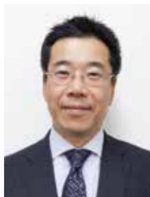
株式会社インシュアランスサービス 損害サービス部 部長