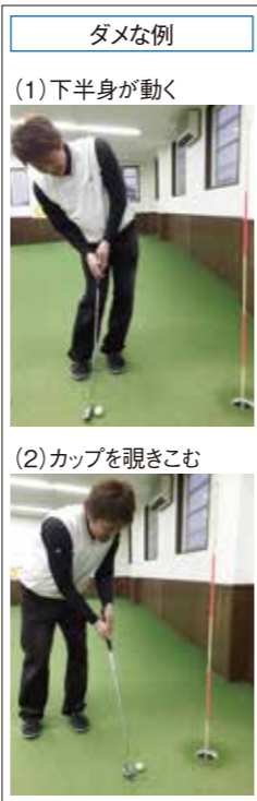
パッティング練習動画