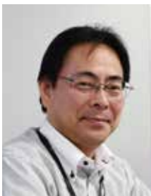
日本アイラック株式会社 CS事業部 シニアマネージャー