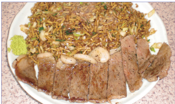
神戸名物そばめしと、牛肉ステーキを一度に楽しめる当店人気No.1メニュー ステーキそばめし1300円