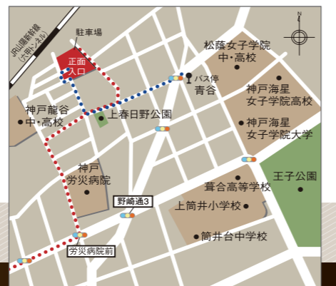
神戸市中央区神仏通3-1-2

■所在地/神戸市中央区神仏通3-1-2 ■構造/規模/鉄筋コンクリート造(一部鉄骨造)1棟地下2階地上6階建 ■敷地面積/2,874.60㎡(賃貸借物件) ■延床面積/5,388.57㎡(賃貸借物件) ■居室数/77室 ■居室面積/ユニットケアタイプ15.75㎡~23.34㎡ マンションタイプ20.80㎡~74.36㎡ ■開設日/平成19年5月 ■共用施設/敷外/エントランスホール、メインダイニング、一時介護室、大浴場、介護浴室、マサースルーム、温泉サウナ、温水プール ■入居資格/マンションタイプ 原則として65歳以上、入居時自立・要支援・要介護である方、 ■居住の権利形態/利用権方式 ■利用権の支払い方式/一時金方式 ■事業主/日本ロングライフ株式会社 ■兵庫県知事指定介護保険特定施設 ■全国有料老人ホーム協会正会員