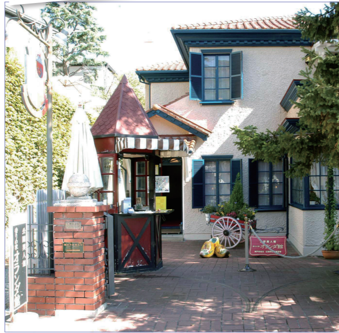
香りの家オランダ館(旧ヴォルヒン邸)