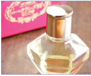
オーダーメイドの香水に感激